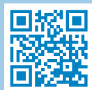
Structure de l'école obligatoire vaudoise